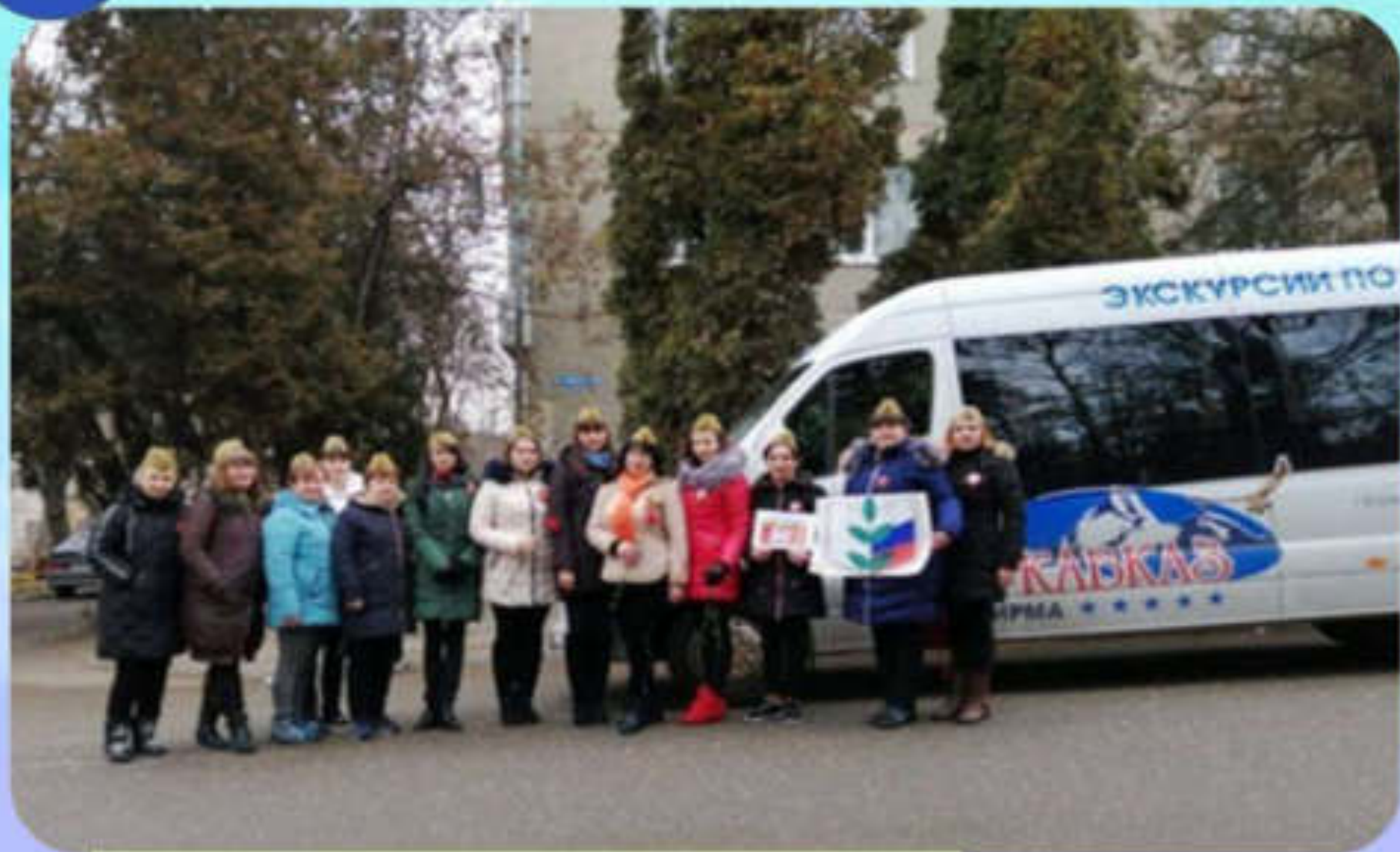
«Экскурсия по местам боевой славы»