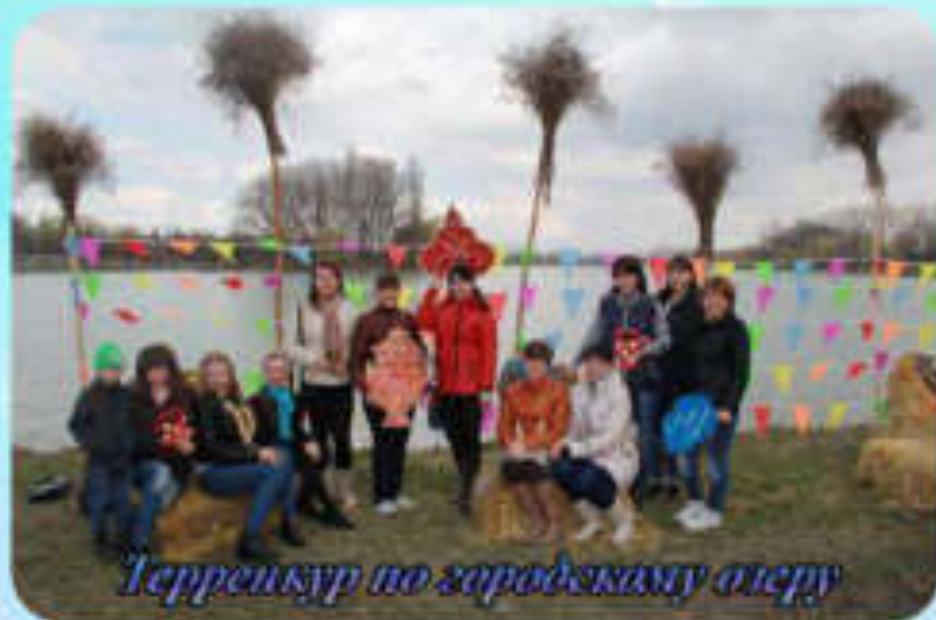
Терренкур по городской пляжу