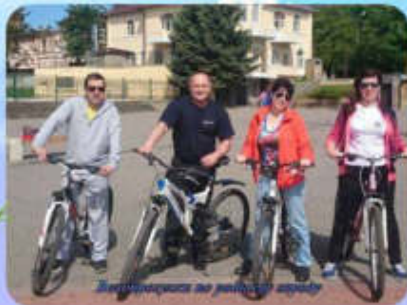
Велопрогулка по пешеходной тропе