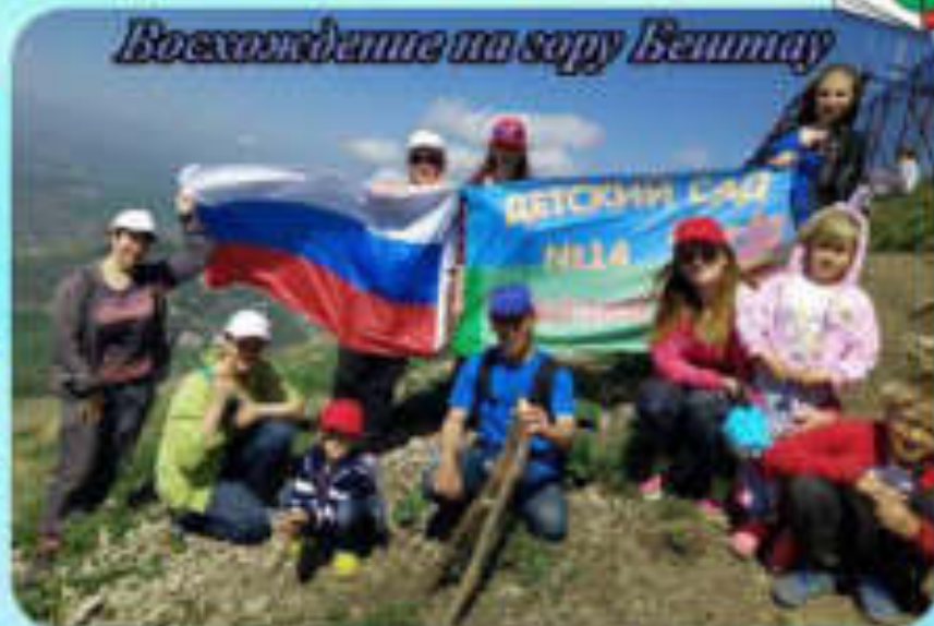
Восхождение на гору Баитая