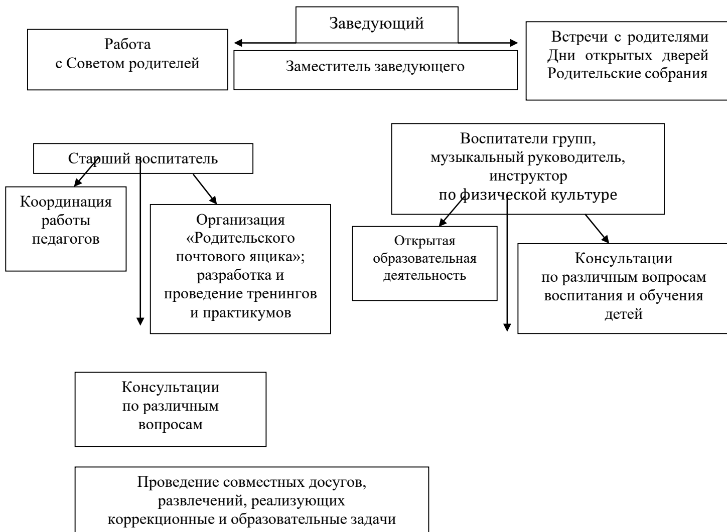
Схема взаимодействия с семьями воспитанников